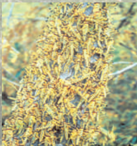
Larven van woestijnsprinkhanen in Niger (onderdeel van een larvenzwerm).