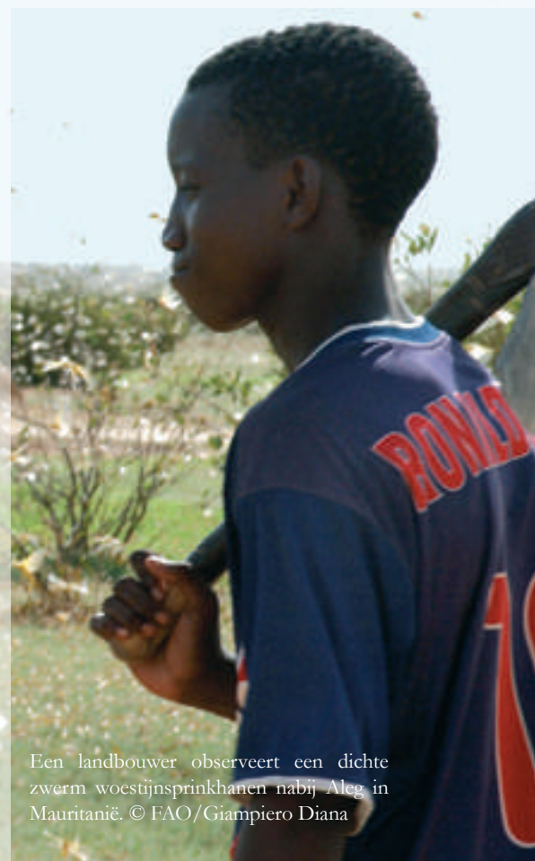
Een landbouwer observeert een dichte zwerm woestijnsprinkhanen nabij Aleg in Mauritanië.

http://eo.belspo.be >Directory > Projects > www