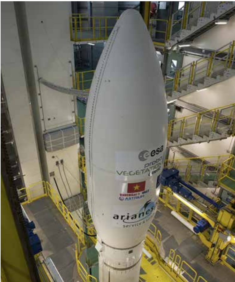
Le lanceur européen Vega est prêt pour sa seconde mission : le lancement en orbite de PROBA-V et de deux charges utiles additionnelles. Il a décollé le 7 mai de Kourou.

truments VEGETATION présents sur les satellites Spot affichaient chacun une masse de 160 kilos. Celui sur PROBA-V ne fait que 33,3 kilos! En outre, l'instrument est désormais équipé d'une mémoire interne de 16 Gbytes, contre 2,5 dans les versions antérieures.