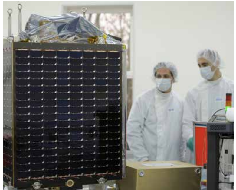
Quelques jours avant sa mise en orbite, au Centre spatial guyanais de Kourou, le satellite PROBA-V est intégré sur le lanceur Vega.

'Nous avons observé des déserts, les océans, les calottes polaires, les nuages et même... la Lune', explique Jan Dries, de l'équipe PROBA-V au VITO. 'Il s'agit là de cibles aux couleurs bien documentées qui permettent de calibrer avec précision le nouvel outil spatial'. Bien sûr, PROBA-V travaillera aussi pendant quelques mois en parallèle avec l'instrument