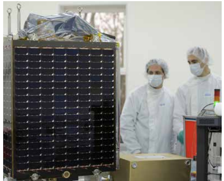
In het ruimtevaartcentrum van Kourou in Guyana wordt PROBA-V enkele dagen voor zijn lancering op de Vega-draagraket geplaatst.