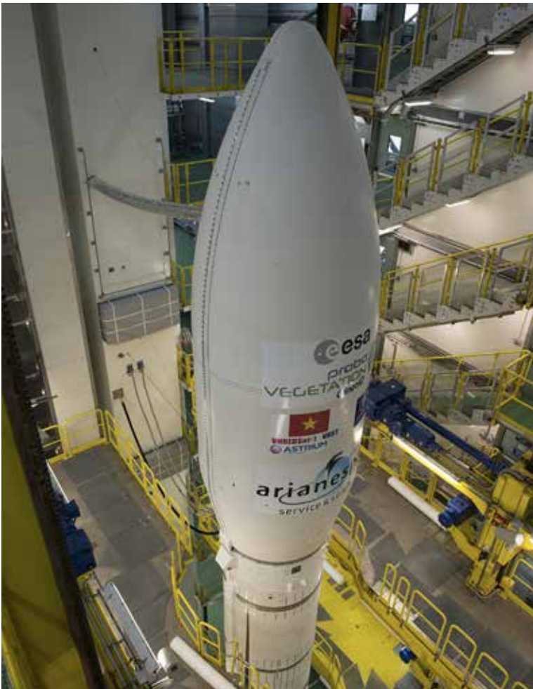
De Europese draagraket Vega is klaar voor haar tweede missie: Proba-V en twee andere nuttige ladingen in een baan om de aarde brengen. De raket steeg op 7 mei van Kourou op.

nog een ander sterk staaltje: de miniaturisatie van de gebruikte technologie. De eerste twee VEGETATION-instrumenten op de SPOT-satellieten wogen elk ongeveer 160 kg. Het nieuwe instrument op de PROBA-V weegt slechts 33,3 kg! Bovendien beschikt het instrument nu over een intern geheugen van 16 GB, tegenover 2,5 GB bij de oudere versies.