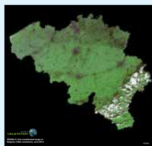
Al in juni stuurde PROBA-V dit beeld van een wolkeloos België door met een resolutie van 100 meter. Het gaat om een onbewerkt beeld van voor de calibratie van het VEGETATION-instrument.

Opmerkelijk is dat alle beelden met een resolutie van 1 km zonder onderscheid gratis aan alle gebruikers ter beschikking worden gesteld. Voor de preciezere gegevens met een resolutie van 1/3 km moet worden betaald als ze recent zijn; beelden ouder dan een maand zijn ook gratis. Onderzoekers die in België en Luxemburg werken, genieten een voorkeursbehandeling: zij hebben gratis toegang tot alle gegevens. |