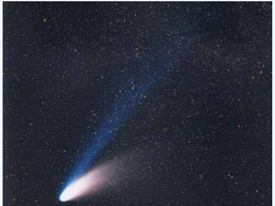
Figuur 1: Komeet Hale-Bopp op 14 maart 1997 met stof- en ionenstaart.

meerdere van deze kometen naar het binnenste van ons zonnestelsel waarbij ze door de zwaartekracht van Jupiter in een baan rond de zon terechtkomen. Wanneer zo een lichaam dicht bij de zon komt, warmt deze op door het zonlicht en komt er gas vrij dat stofdeeltjes met zich meeneemt.