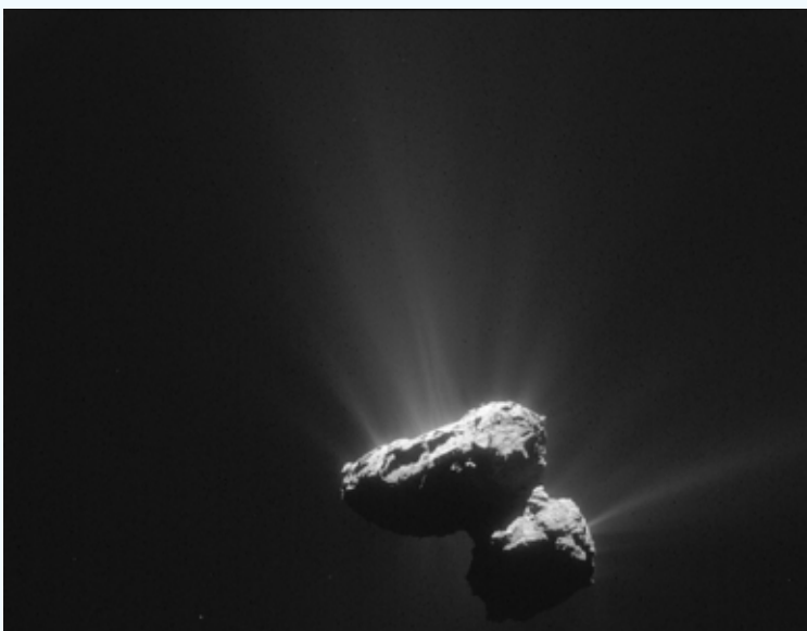
Figuur 4: De kern van komeet 67P/Churyumov-Gerasimenko op een opname van 14 juli 2015.

In maart 2004 heeft ESA zijn ruimtesonde Rosetta gelanceerd. Gedurende haar reis van tien jaar naar de komeet werd de snelheid van Rosetta verhoogd door gebruik te maken van de gravitatie van planeten. Hierbij passeerde ze eenmaal dichtbij Mars en drie maal dichtbij de aarde. Op deze manier kreeg Rosetta een snelheid die dichtbij deze van de komeet lag en kon ze de komeet traag naderen en in een berekende baan rond de komeet worden gebracht. De reis van Rosetta is te zien in figuur 2. In augustus 2014 is Rosetta eindelijk zeer dicht (100 km) bij komeet 67P/Churyumov-Gerasimenko (67P) aangekomen. Rosetta is bij de komeet gebleven tot 30 september 2016, toen ze op de komeet is neergedaald.