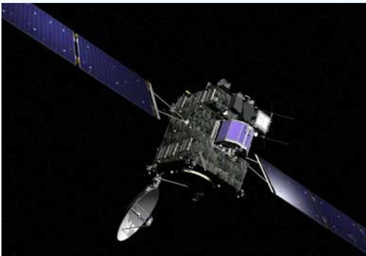
Figuur 3: De ruimtesonde Rosetta.