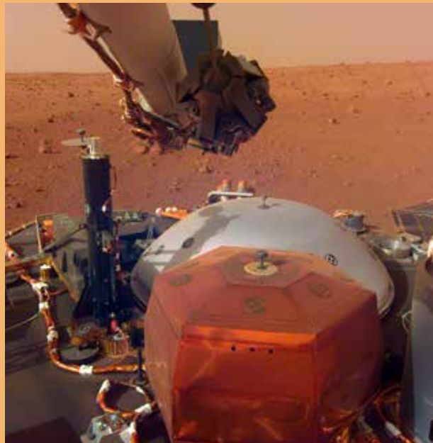
Foto van de instrumenten SEIS en HP 3 op het platform, vóór hun installatie op het Marsoppervlak, tegen een achtergrond van het landschap van Mars.

Het tweede instrument is de Duitse warmtesonde HP 3 (Heat Flow and Physical Properties Probe). Het meet de warmteflux die uit het oppervlak van Mars ontsnapt. Het derde wetenschappelijke instrument, geleverd door NASA, is een radiotransponder genaamd RISE (Rotation and Interior Structure Experiment). Het reflecteert de radiogolven die het vanop de aarde ontvangt terug naar radiotelescopen op aarde, zoals een elektromagnetische spiegel. Ook andere hulpinstrumenten werden op het platform geplaatst: meteorologische instrumenten om temperatuur, atmosferische druk en windsnelheid te meten, een magnetometer en twee camera's. De camera's zijn niet bedoeld om ons elke dag een prachtig Marspanorama in kleur te sturen, maar wel om SEIS en HP 3 zo goed mogelijk te installeren op de bodem van Mars. Dankzij de camera's heeft het team een vlak gebied kunnen selecteren dat geschikt is voor de metingen ten zuiden van het landingsgestel, waar temperatuurschommelingen als gevolg van de schaduw van het platform kunnen voorkomen worden. Op 19 december 2018 tilde de grijper op de robotarm de seismometer op en plaatste deze op de grond, op 1,6 meter van het platform. Een zonnwijzer boven op de seismometer maakte het mogelijk om de oriëntatie van de seismometer met grote precisie te bepalen. Dit mag een verrassend systeem lijken voor ons, gewend als we zijn aan de technologie van de 21ste eeuw, maar aangezien Mars geen globaal magnetisch veld heeft en geen GPS-netwerk