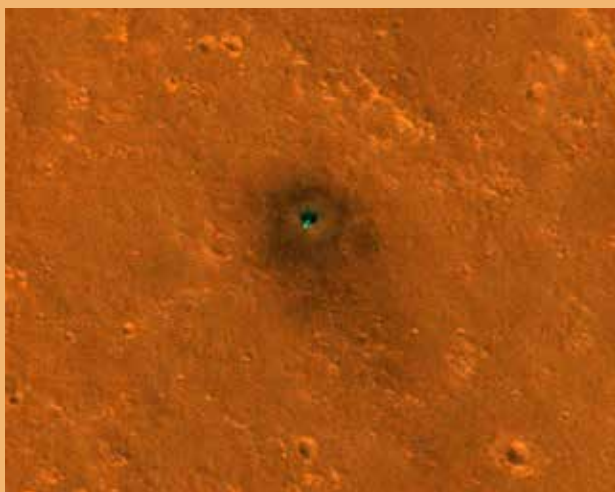
Foto van de landingszone van InSight gezien vanaf een satelliet in een baan rond Mars op een hoogte van enkele honderden kilometers. Het lichtpunt is het thermische beschermingsschild dat de seismometer bedekt. Op aarde is het vrij zeldzaam om een seismometer te kunnen fotograferen vanaf een satelliet, omdat deze meetapparatuur zich meestal goed beschermd in een kelder of grot bevindt. Bij de landing werd een laag fijn stof door de retro-raketten opgeblazen, waardoor er een donkere zone rond het landingsgestel ontstond.

Laten we hopen dat deze geofysische ontdekkingsreiziger veel bevingen van Mars zal meten en lange tijd zal overleven op het oppervlak van Mars!