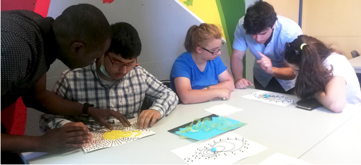
Des étudiant-e-s aveugles et malvoyant-e-s interagissent avec les images tactiles de la météo spatiale, assisté-e-s par des enseignant-e-s et des chercheur-euse-s. Plusieurs images tactiles sont disposées sur des tables grises dans une salle au décor lumineux, devant trois étudiant-e-s et deux assistant-e-s, qui interagissent avec les phénomènes décrits par les images.

leurs connaissances sur la météorologie spatiale, mais ils ont également développé une plus grande appréciation de l'inclusion et des diverses façons dont les individus perçoivent le monde et interagissent avec lui.