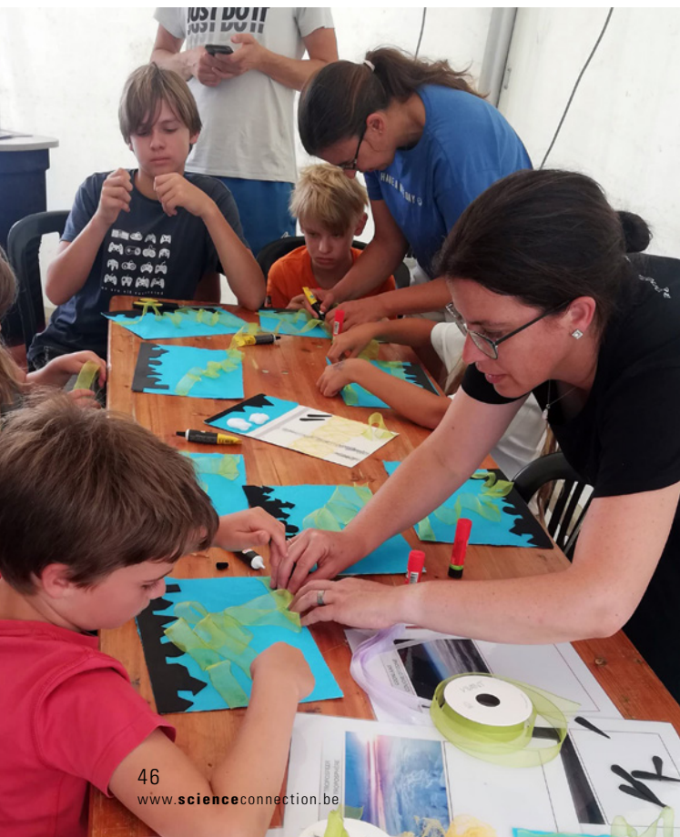
Kinderen zonder visuele beperking maken tactiele beelden van het poollicht in Astropolis Space Village in Oostende. Deze tactiele afbeeldingen zullen samen met educatief materiaal in de vorm van 'A Touch of Space Weather'-dozen aan scholen geleverd worden.

ele beperking. Deze sets met afbeeldingen voor scholen, zijn al voorbereid door studente-n-s zonder visuele beperking tijdens de bovengenoemde workshops.