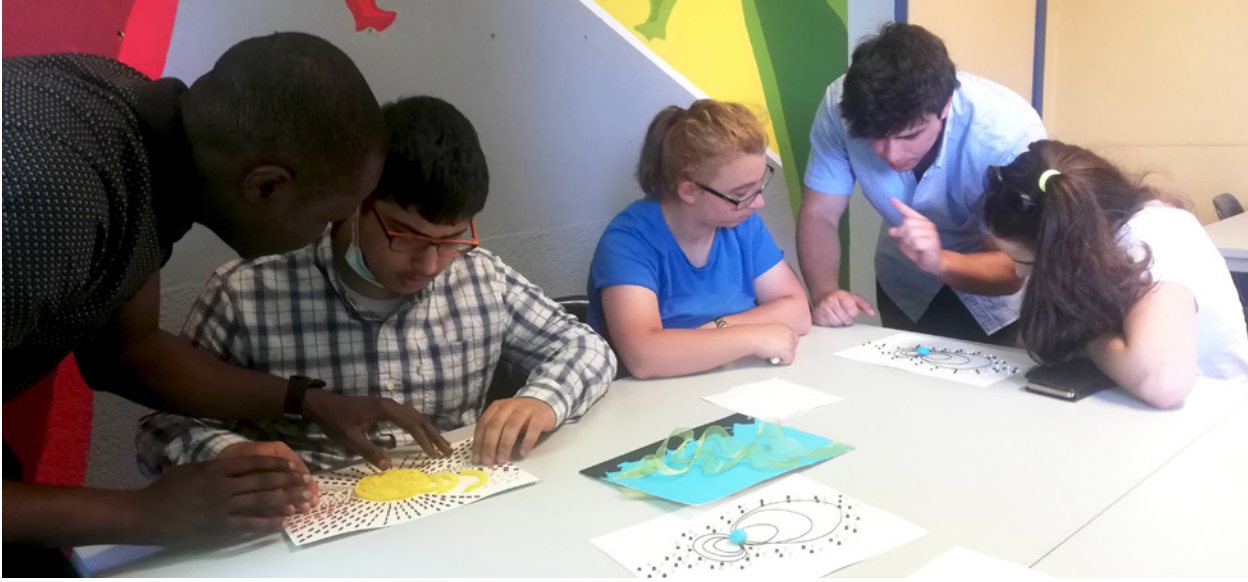
Leerlinge-n-s met een visuele beperking maken kennis met de tactiele afbeeldingen van ruimteweer, bijgestaan door leerkrachten en onderzoekers. Verschillende tactiele afbeeldingen zijn verspreid over grijze tafels in een helder ingerichte ruimte, voor drie leerlinge-n-s met twee assistente-n-s, terwijl ze interageren met de verschijnselen die door de afbeeldingen worden beschreven.

tere waardering voor een meer inclusieve samenleving en voor de verschillende manieren waarop individuen de wereld waarnemen en ermee omgaan.