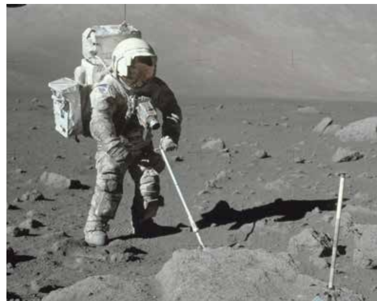
Apollo 17-astronaut Harrison Schmitt verzamelt een bodemonmonster, zijn ruimtepak bedekt met stof. NASA-afbeelding AS17-145-22157.

De aanwezigheid van deze geladen stofachtige deeltjes op de maan - maar ook op Mars, kometen en asteroïden - vormt een echte uitdaging voor toekomstige (bemande en onbemande) verkenningssmissies naar hemellichamen in het zonnestelsel. Naast het in gevaar brengen van de gezondheid van de astronaut-e door irritatie en inademing van het maanstof, heeft het nog veel meer gevaarlijke (instrumentele) effecten. Om er maar een paar te noemen: scheuren in het ruimtepak, verduistering van het zicht, foutieve instrumentale metingen, stofophoping en -vervuiling, obstructie van zonnepanelen, verlies van grip, verstopping van mechanismen, slijtage, thermische controleproblemen (oververhitte radiatoren) en defecten aan afdichtingen.