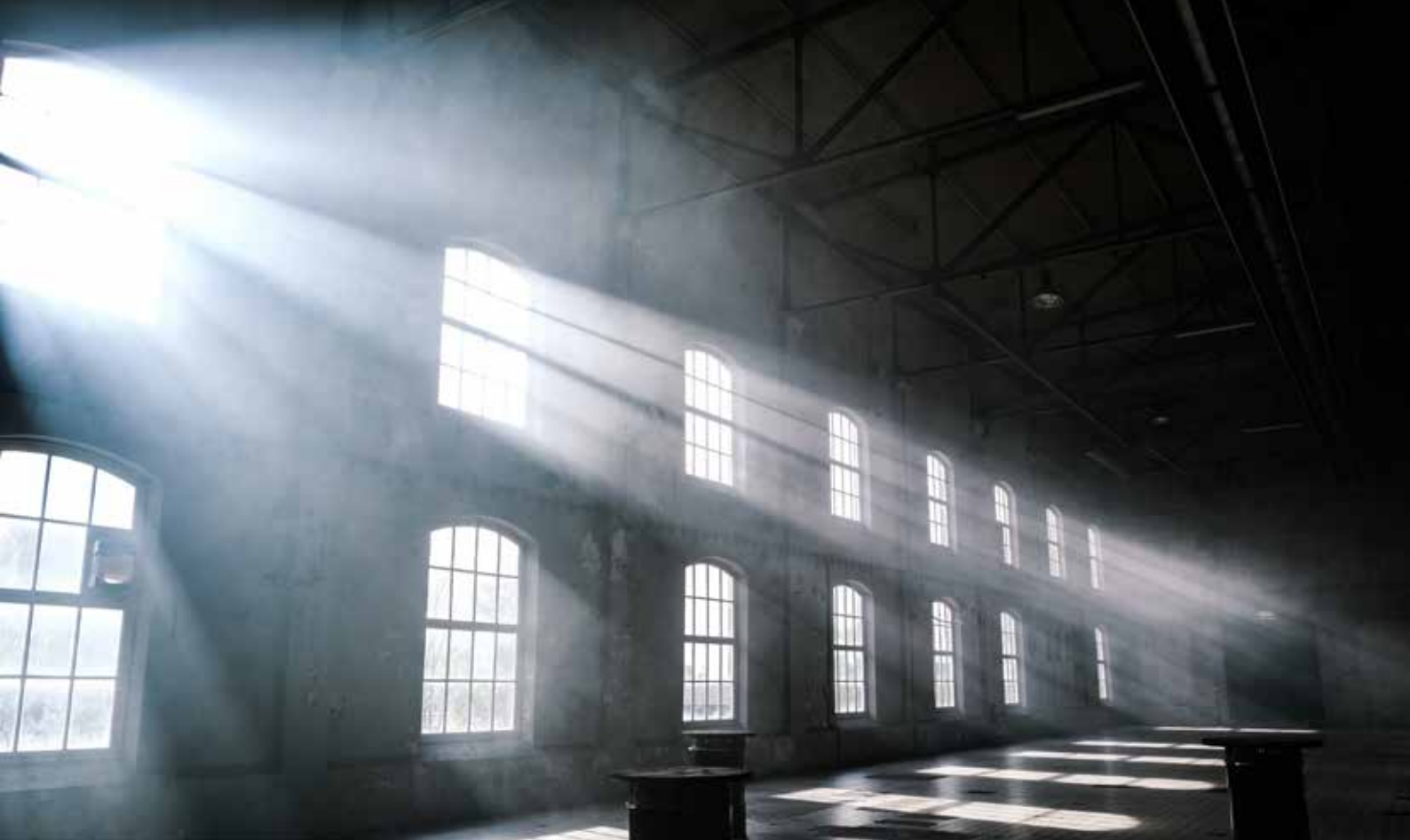
Stof verlicht door een bundel zonnestralen.