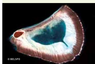
↑↑ Les récifs coralliens sont des écosystèmes parmi les plus riches au monde.