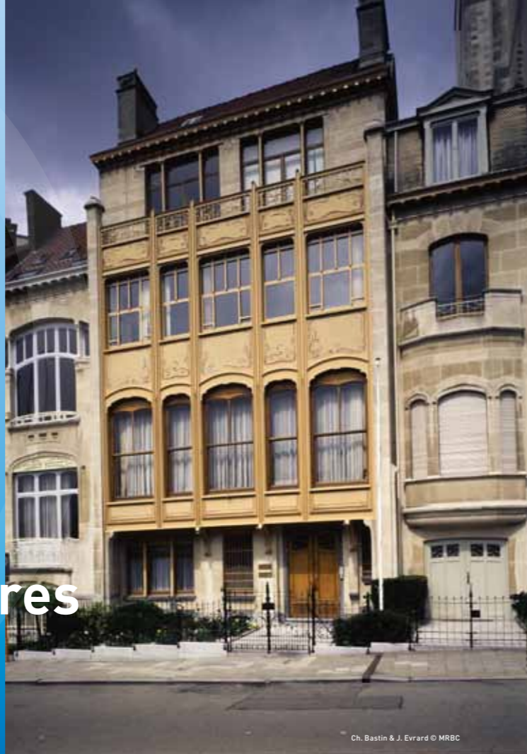
Ch. Bastin & J. Evrard © MRBC